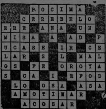
Solución del Crucigrama N.º 30.

Vea la solución de este Crucigrama N.º 31 en nuestra próxima edición.